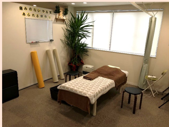
事業所の内観（施術ルーム）

施術メニューのほか、自宅で手軽にできるストレッチ・体操等の指導や日常生活をサポートする商品も販売しています。