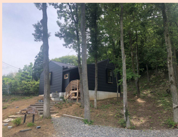
お店は緑豊かで閑静な住宅街にあります