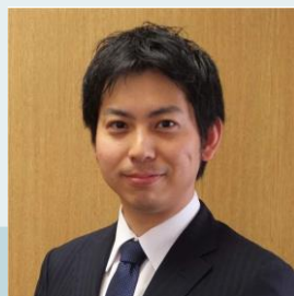
氷見市ビジネスサポート センター (Himi-Biz) センター長

2011年、団体を一部事業化し起業する。その後、株式会社ガクトラボを設立し、実践型インターンシップ事業、採用活躍支援事業、学生活動キャリア支援事業を実施。現在、金沢市起業家実践アドバイザー、石川地域づくりコーディネーター、金沢大学地方創生人材教育プログラムコーディネーターを歴任する他、他地域でのまちづくりにも関与するなど活躍中。