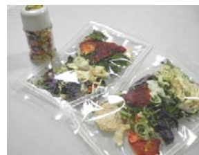
【ドライベジタブル商品】

(有)まるしょうは、昭和56年より漬物製造販売を行ってきたが、近年の食生活の変化による日本人の食生活の欧米化、若者を中心とした漬物離れ、さらに家庭で簡単に作れる「浅漬け物の素」の需要の高まり等とともに売上が減少していた。また、農家では、経営安定化のため、野菜の高付加価値化、廃棄または低価格で引き取られる規格外野菜の有効活用を模索していた。そこで予めより野菜不足となっている現在の食生活において多種類の野菜を手軽に摂取できるよう農家三者と連携し、それぞれの得意とする野菜を生かし、野菜不足となっている現代社会に提供できる商品作りを始めた。