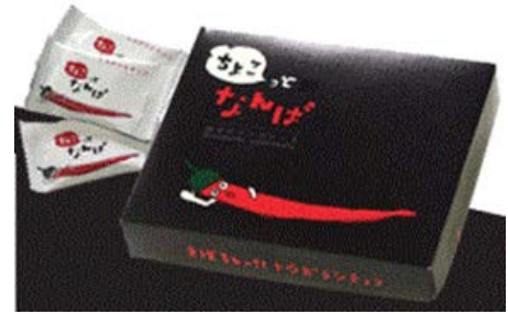
剣崎なんばを活用したチョコレート

(株)Anteの主力商品であるサイダーやゼリーは夏季を中心とした商品のため、冬季向け商品の開発が課題であった。一方、剣崎なんば生産組合では、一味唐辛子等の既存商品以外にも、唐辛子を活用したスナック菓子など新たな商品開発や、未利用となっていた完熟前の青色の唐辛子の有効利用を模索していた。このような経緯において、両者が連携して、唐辛子を活用したチョコレートの等の各種商品を開発・販売することとなった。