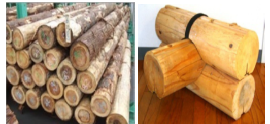
<ログの主原材料となる杉>

かが森林組合は、FSC森林認証の取得など持続可能な森林保全に取り組む中で老齢樹の伐採や安定した販路先の確保に課題を有していた。一方の(株)北陸リビング社では、地元産材を活用したログハウスの普及啓発を検討していた。そこで、豊富な地元産材を活用した内装デザインやオーダー家具の提案、薪の安定供給など各種新サービスを積極的に提案していくため、両者で連携し、ログハウスの販路拡大並びに地元産材の需要拡大に取り組むこととなった。