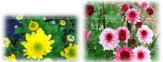
小菊とスプレー菊

JA松本ハイランドは、土壌改良や効果的な施肥設計により日持ちのよい高品質な菊を栽培。更に、野菜等から花き生産に転換するリスクの軽減及び品質の安定化を図るため、栽培マニュアルの策定に取り組む。(株)ジャパン・フラワー・コーポレーションは、流通時における温度管理の徹底や細菌対策、水分・栄養分の管理、葉緑素計を活用した鮮度管理を徹底することにより、日持ち保証を付加した顧客満足度の高い小菊及びスプレー菊の安定的な提供を実現する。