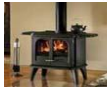
【薪ストーブ使用イメージ】