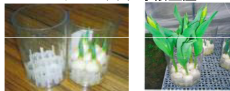
<観賞用水耕栽培チューリップ商品>