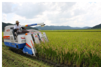
<「フクノハナ」稲刈り>

酒造メーカーである(株)福光屋はお米の醗酵技術を応用したノンアルコール醗酵食品の製造・販売を計画。商品開発には、品質が高く安心・安全な酒米が欠かせないことから、従来から、兵庫県豊岡市出石町だけで生産されている酒米「フクノハナ」を使用した純米酒「コウノトリの贈り物」の製造で連携しているたじま農業協同組合と本事業を開始した。