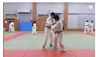
【金沢大学で柔道体験】