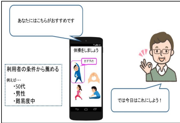
アプリのイメージ