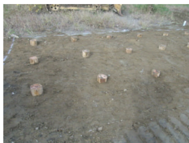
完了後の地盤表面