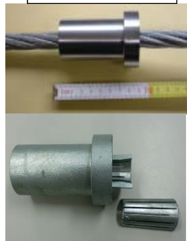
緩衝金具(特許出願中)