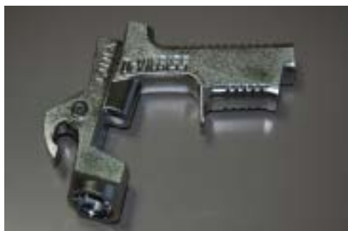
塗装用スプレーガン(ハンドガン)部品のめっき例