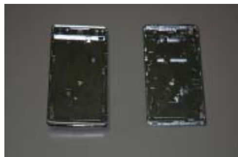
携帯電話用ボディ部品のめっき例