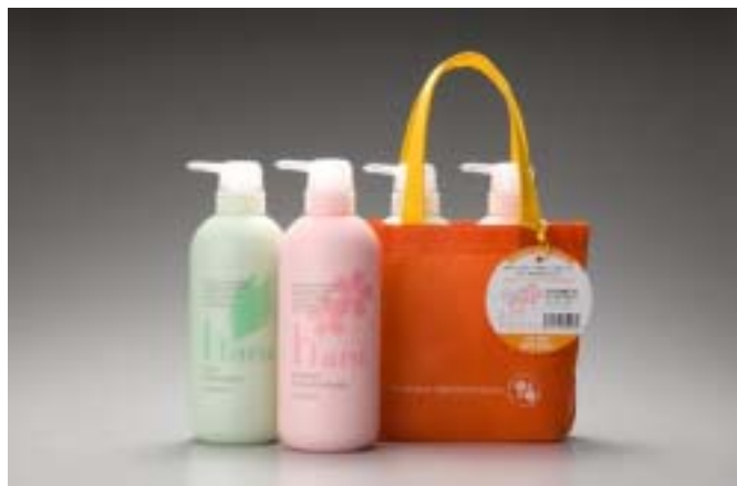
春プランのシャンプー及びコンディショナー