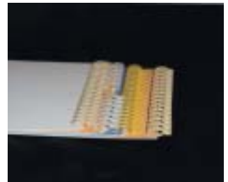
ペーパーリング製カレンダー