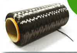
「合成繊維の織編技術を炭素繊維分野へ応用」