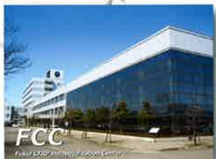
「開織技術の開発 ふくいCFRP研究開発・技術経営センター(FCC) (福井県工業技術センター)」