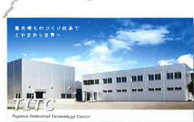
「高機能素材ラボ(富山県工業技術センター)」