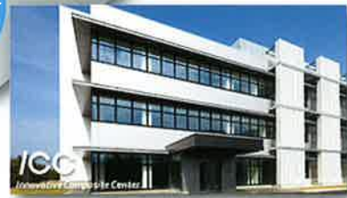
「革新複合材料研究開発センター(金沢工業大学)」

【戦略産業の方向性】 川上から川下まで、幅広い分野におけるきめ細かいイノベーションが必要となる軽金属分野、炭素繊維分野の産業集積化を目指す！