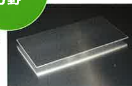
「アルミニウム押出品やサッシの出荷額が全国一」