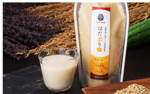
【「はだ恵り(めぐり)シリーズ」】

地域の農家からの農作物の供給、地元大学との共同研究、米麴の供給などをうけていく。