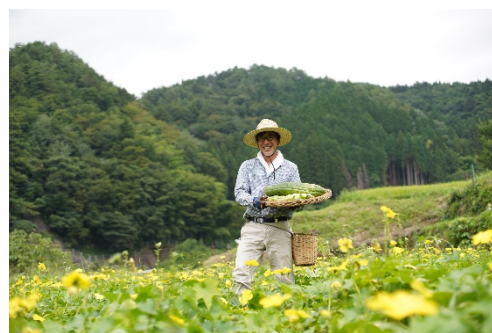
【郡上市母袋(もたい)地区の自社農場と農作業をする代表者】