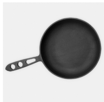
【本商品: おもいのフライパン】