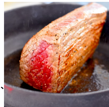
【調理イメージ画像】