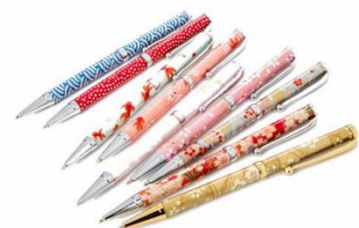
【本製品: 美濃和紙製】