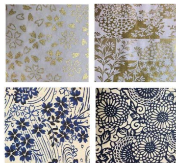
【オリジナル柄美濃和紙】

岐阜商工会議所には会員として加盟し活動しており、岐阜県産業経済振興センターに事業計画及び実施に係る支援を受け、事業を推進している。