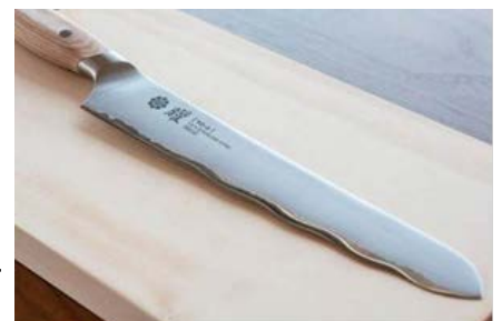
【独特の刃形状により優れた機能性を持つパン切り包丁】