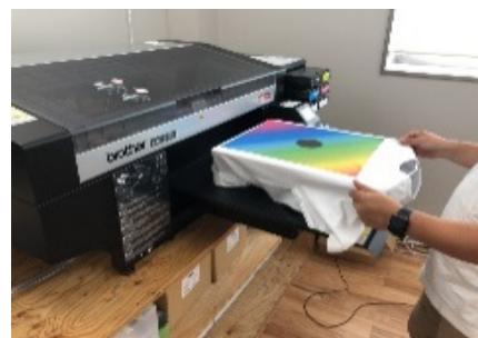
【Tシャツプリント用 ガーマントプリンター】

個人からのネット受注データを自社の生産工場との生産指示発注データとシームレスにつなげることで、納期や仕上がり品質などを安定化させることが特性となる。