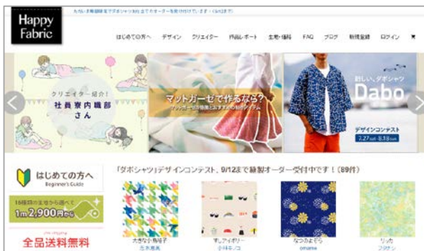
【自社サイト Happy Fabric】

地域産業資源「名古屋のアパレル」「愛知のIT技術と関連製品」の生産に係る技術を活用し、個人及び個人向けのものづくりサイト運営法人や一般企業の販促部門でも転用できる自社オリジナル受発注プログラムを開発、WEB上で簡易な発注作業だけで単品から中小ロットまでの数量をTシャツや他のファブリック製品等を短納期でプリント・オン・デマンドサービスとして製造提供を行う。全国のプリント工場事業者などへの波及効果が期待される。