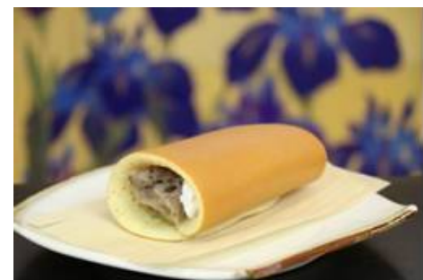
【本事業商品 大あんまき クリーム&オレオ】