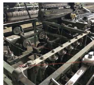
【糸の張力を均等に保つ(多段式糸送り機構の導入)ことにより編地の柄・模様のよじれ・歪みを解消】

「尾州の毛織物」で培われた「一定ではない糸の状態を巧みに操る技術力」を本事業で用いる編み機に应用することにより、江戸時代に尾州地域で一世風靡した「尾張縞」を現代風にアレンジした柄・模様を意匠性高く本製品に施すことを可能とした。本製品を「owarisima」ブランドとして拡販することにより尾州地域の知名度向上、ならびに地場産業への波及効果が期待できる。