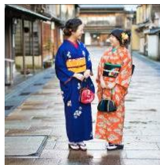
【着物が似合う茶屋街】

本事業では価格競争に陥る危険性を回避するために、競合する他店とのサービス付加価値の差別化を図り、本県の地域資源である加賀友禅や金沢の茶屋街等を活用した、金沢ならではの和風スタイル観光を彩る着物レンタルサービスの開発と提供を実施する。