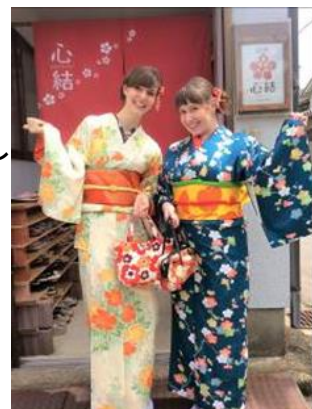
【インバウンドの事例】

今後、需要の拡大が期待できる、インバウンド客や40~50代の女性旅行者を新たなターゲットとし、いかにして本事業の情報を届けるかを重要視し、広報、広告、スマートフォンでHPを見やすく改善し多言語化を進めていくと共に、販売チャネルの拡大として展示会の出展や旅行代理店への周知を図っていく。