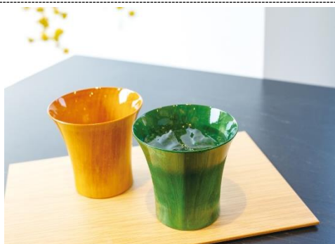
山中漆器組合推薦作品