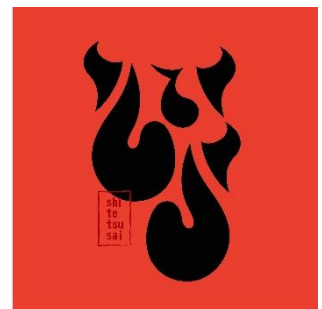
職手継祭ロゴマーク