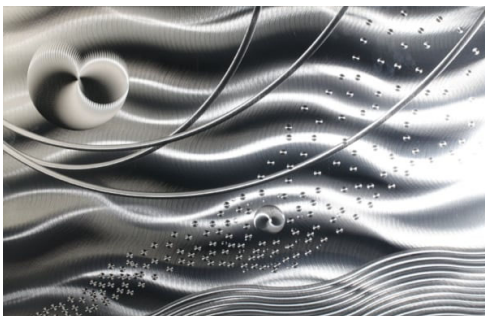
研磨加工によるデザイン