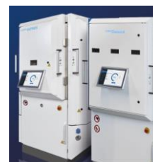
ダイヤモンド・HiPIMS コーティング装置