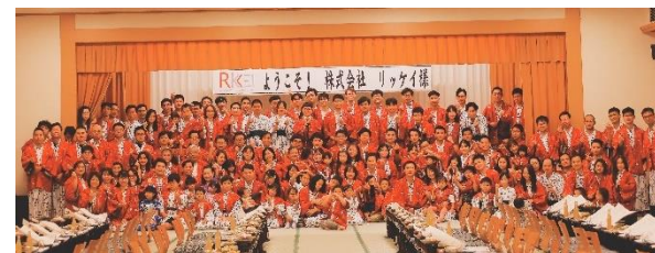
名古屋支社の社員旅行での集合写真