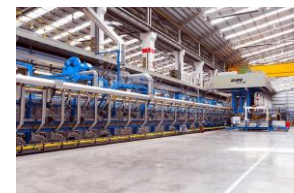
ホットプレスライン