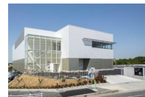
オートモーティブテクノロジーセンター外観 (愛知県みよし市)