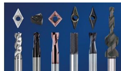
同社によりコーティングを行った 切削工具例