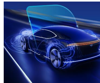
車載組み込みソフトウェアのイメージ