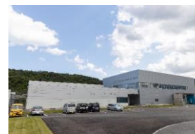
本社EMC試験所外観 (三重県伊勢市)