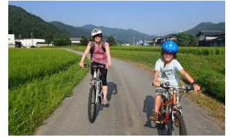
高山での里山サイクリングの様子