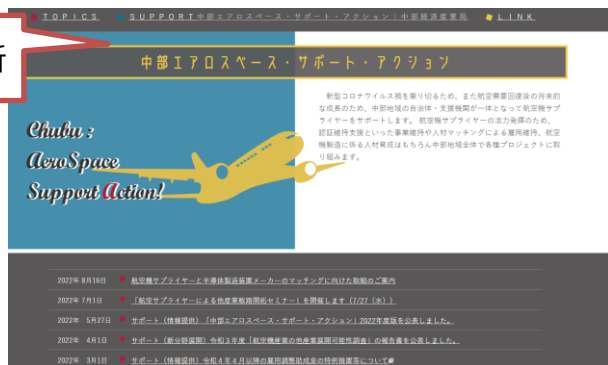
・中部経済産業局 特設サイト