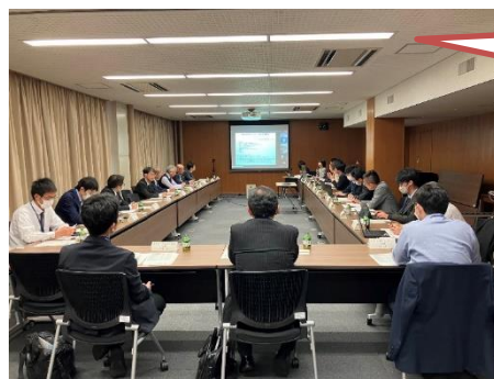
・エアロマート支援会議の様子