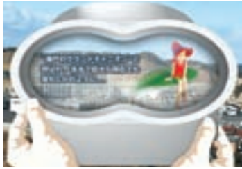
情報表示イメージ