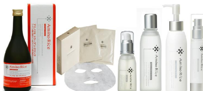
コメ発酵液を使った化粧品シリーズ

コメ発酵液(FRS-01)を使った化粧品シリーズは基礎化粧品以外にも、美容に良い飲料など幅広い分野で商品開発を行っている。こうした取り組みは海外でも注目され、フランスの化粧品メーカーが参画する団体「コスメティックバレー」との連携により、コメ発酵液を使った化粧品の共同開発を進めている。