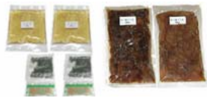
【びんトロ・かつおセット】