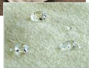
【ナノ加工(防汚、撥水、撥油)のニット製品】