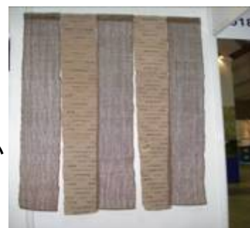
【栗菓子の銘店 中津川市の“すや”の暖簾】