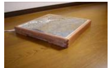
【足岩盤浴(平R型 柿渋)】