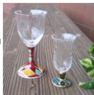
【売価5千円クラスの商品】