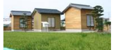
家屋機能比較実験棟