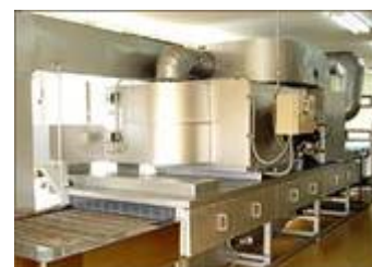
【ナノテク低温熱処理加工機】