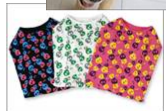
ドクロパーティータンク moscape