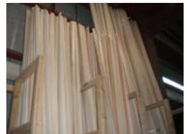
事前作製した部材の備蓄