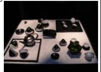
【 禅九谷様式 】