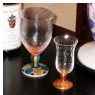
【売価1万5千円クラスの商品】