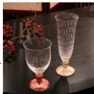
【売価5万円クラスの商品】