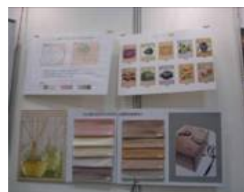
【カラーバリエーション】