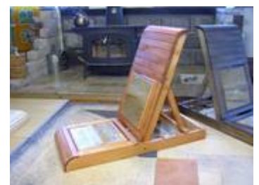
【足岩盤浴(座椅子 柿渋)】