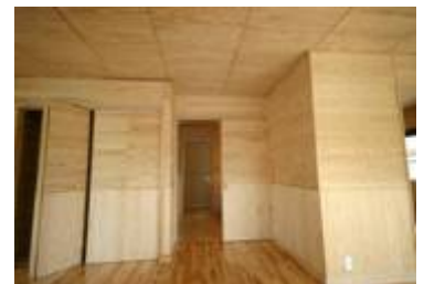
パネル工法施工例