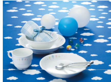
リサイクル原料を使った給食用磁器食器 キッズメイト CO 2 を「見える化」している 朝日化工 (株)HPより

※本セミナーは、中部経済産業局の平成23年度国内排出削減量認証・取引制度基盤整備事業によるものです。ソフト支援事業者として、中部経済産業局より三菱UFJリサーチ&コンサルティング株式会社が委託、株式会社ウエイストボックスが再委託されています。