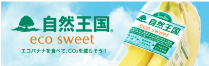
カーボン・オフセットを活用 CO 2 を「見える化」している

本業にエコ活動を取り入れて売上につなげたい、CSRレポートに新たなエコ取り組みを載せたい、上手に環境PRしたいという方々のご参加をお待ちしております。