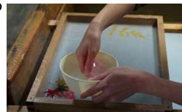
【越中和紙漉き体験】