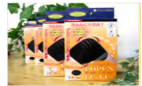
ぽっぷん☆るーるー 【膝(ひざ)サポーター】