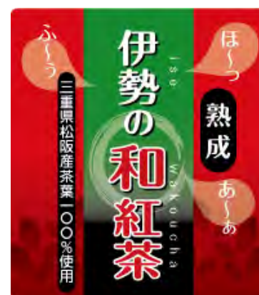
【イメージデザイン】