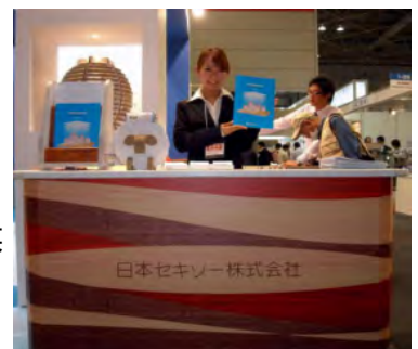
【カウンター等の什器】