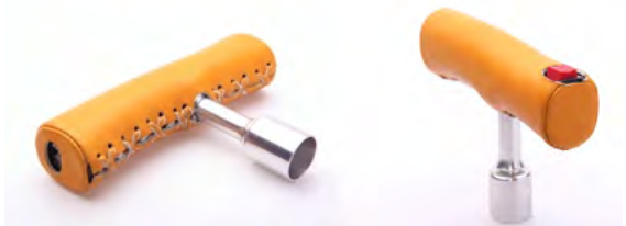
【専用グリップカバー】