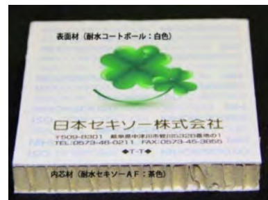
【白パネル・・・印刷加工したもの】