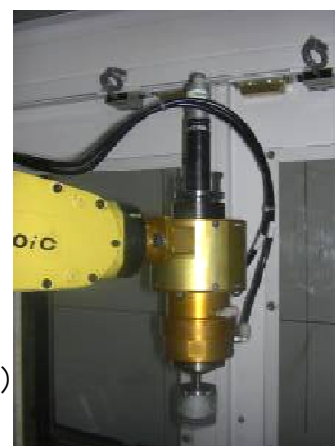
【あの手・この手・その手】