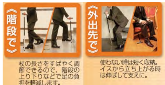
【様々なシーンに対応】