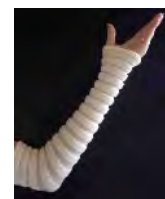
ぽっぷん☆るーるー 【肘(ひじ)サポーター】