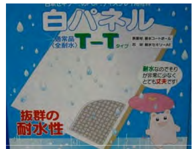
【白パネル・・・耐水タイプ】