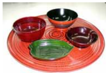
【木質バイオマス製品】