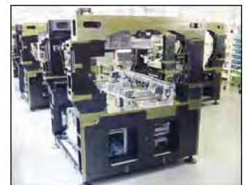
【実装機フレーム完成】 (コクネ製作(株))