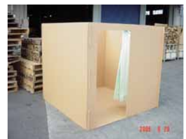
【避難所パーティション】