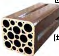
【地中埋設ケーブル保護用 異孔16孔複合管 「セラダクトA タモクト」】