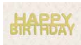
【アニバーサリー金箔】