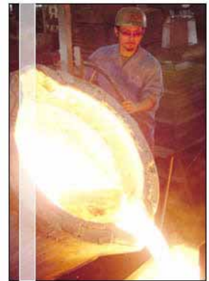
【鋳物フレーム鋳造工程】(株)古久根)