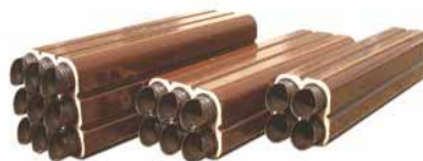
【トンネル専用多孔陶管 「セラダクトA neo」】

・今回、従来の耐火性・耐震性やエコ(陶磁器粉碎物などをリサイクル)といった特長に加え、最近の工事関係者のニーズ(敷設時の簡易さ、滑走路下での高強度、直径の異なる多孔配列など)に応える機能・品質を確保した「セラダクトA」の新しいラインナップ商品を開発した。