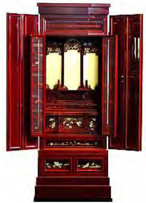
【春慶仏壇】 飛騨高山春慶塗仏壇 蒔絵入り H159 × W59 × D51(cm)