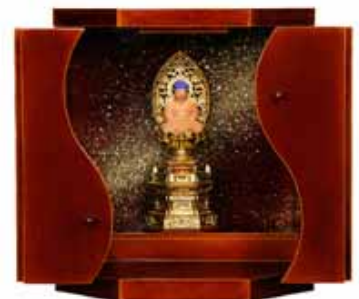
【小型供養壇】 ～MAGATAMA春慶～ H38 × W35 × D27(cm) 岐阜県の平成19年度「飛騨 美濃すくれもの」に認定