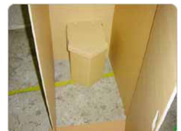
【便座(収納袋・パウダー付)】