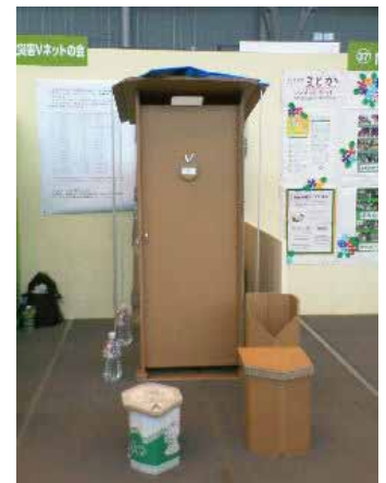
【緊急トイレボックス】