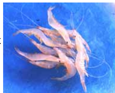
【富山湾特産 シロエビ】

・「富山湾の宝石」とも呼ばれる富山特産のシロエビの多くはむき身で出荷されているが、その場合、約7割の殻が廃棄されている。このシロエビの殻の有効活用を図るため、殻を独自の殺菌処理と乾燥技術により生臭さを排除し、シロエビ本来の香りと味を生かした風味調味料として量産供給を実現。 ・超微紛パウダーとすることにより他の製粉等と混ざり易くなることから、麺類、粥、菓子等の加工食品への風味調味料として新たな業務用需要の開拓・拡大を図る。また、一般家庭向けとして、料理だし・タレ・スープ等への添加調味料の販売もあわせて計画する。