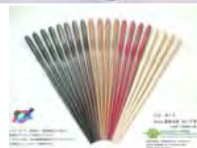
【アグリウッド製品】