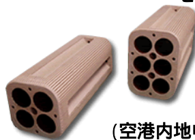
【高強度部 (空港内地中埋設)専用陶管 「セラダクトA エル・ソタ」】