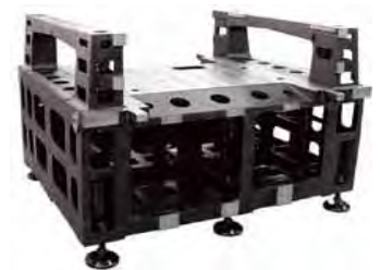
【実装機フレーム完成】 (コクネ製作(株))